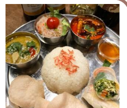
タイセット1,580円(HPより)

私のおすすめは柏駅東口より徒歩6分の「アジアンダイニングLUMBINI柏店」です。タイ料理が食べたくてネット検索して行ってきました。お昼過ぎでしたが店内はファミリーも多く賑わっていました。店員さんの対応も良かったです。土日祝限定の「ホリデーバイキング」(¥1500)も魅力でしたが、ランチセットメニューの中から、今回はタイプレート(鶏グリーンカレー、エビレッドカレー、生春巻き、春雨サラダ、シュリンプチップス、ライス)を選びました。運ばれてきた料理を見た瞬間、「うわ、おいしそう！」と写真を撮るのも忘れ夢中で食べてしまいましたが(笑)、タイ料理初体験の友達も「おいしい！」と喜んでくれました。タイ料理の他にインド、ネパール、ベトナム料理などメニューも豊富で、しかもリーズナブル♪次回行った時には他の料理も色々試してみたいと思います。(保育士 W)