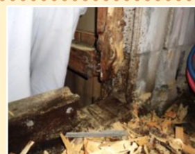
水漏れによる浴室ドア付近の腐った木部