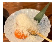
つくね卵黄チーズ ¥290