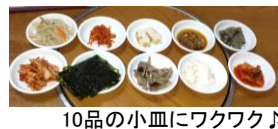
10品の小皿にワクワク♪