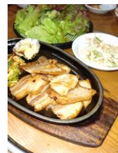
サムギョプサル1500円

夕食に自宅近くの韓国家庭料理「富ノ家」に行ってきました。席が掘こたつになっているので落ち着いて食べることができます。席につくと韓国流にすぐお通し10品が出てきます。これだけでお酒のつまみになりそう(笑)うれしいサービスです。今回は海鮮チヂミ、豚バラ肉のサムギョプサル、オサムブルコギ(イカとバラ肉のピリ辛煮)を注文。味は辛さが効いて美味しい！特にサムギョプサルがお気に入り、サンチュにバラ肉・ネギ・みそを巻いてごま油のタレをつけていただきます。量がたっぷり食べきれず、お持ち帰りにして翌日おいしくいただきました。ランチメニューもありますので、本格韓国家庭料理が食べたくなったら、ぜひ訪ねてみてください。 T(医療事務)