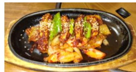
オサムブルコギ1500円

市川市八幡1-11-13 TEL 047-336-5775 月～土・祝 定休日/日 営業時間 11:00～14:30 17:00～23:00