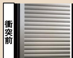
シャッターを設置した場合