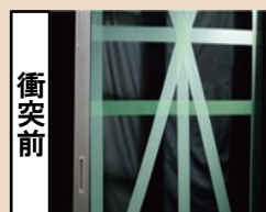
養生テープを貼るだけの場合